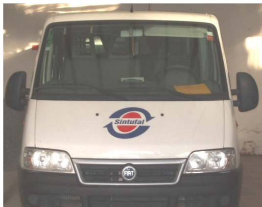
Veículo para os serviços da entidade sindical