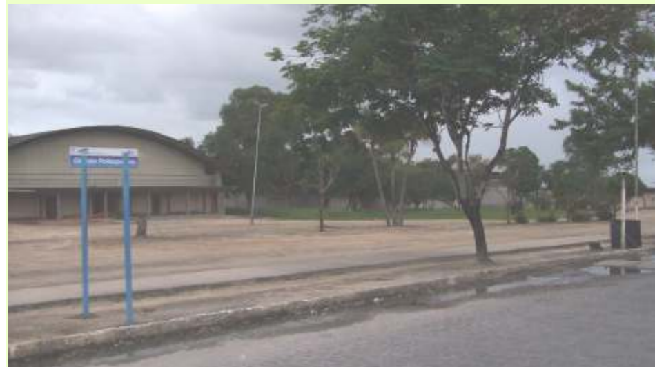
Nova sede deve ser construída em área próxima ao ginásio de esportes

Atendendo a uma reivindicação antiga da categoria de ter um espaço do sindicato dentro do Campus, a direção do SINTUFAL vai construir um prédio na Cidade Universitária que tenha um auditório para 300 pessoas, salas de reuniões, além de uma área destinada a eventos da categoria, exibição de filmes entre outras utilizações.