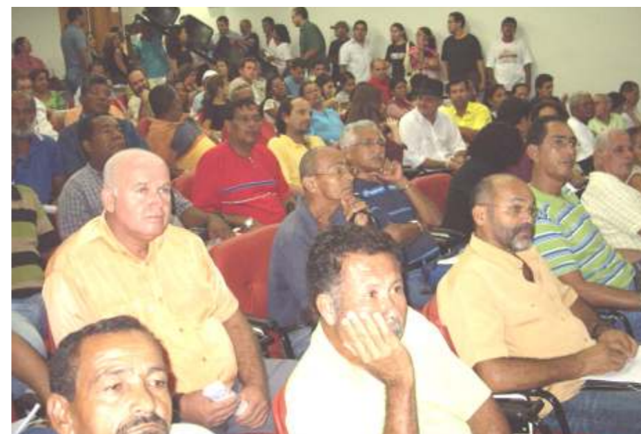
Trabalhadores mobilizados em defesa da Convenção 151 da OIT

Um total de 44 países já ratificaram a convenção 151 no mundo. Na América Latina são dez países, entre eles, a Argentina, Chile, Colômbia e Uruguai. Aqui no Brasil estamos dando início ao processo de mobilização para ratificar a Convenção 151 da Organização Internacional do Trabalho (OIT).