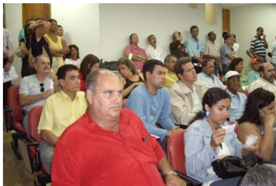
Categoria aprovou balanço de 2007

Mesmo havendo uma mobilização orquestrada por setores que defendem o ditado "do quanto pior melhor", que tentaram a todo custo reprovar as contas e esvaziar a assembléia, a voz dos justos foi mais forte. O que nos chamou atenção, diz respeito ao fato de ex-dirigentes do sindicato ou até mesmo ex-integrantes de comandos de greve, no intuito de assumirem o papel de defensores da "moralidade",