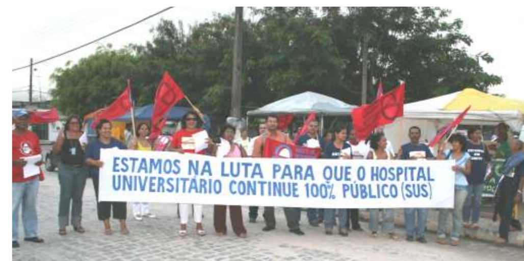
Manifestação em defesa do Hospital Universitário

Todos que tem responsabilidade com esse país devem rejeitar e denunciar para a sociedade o repasse desses serviços para iniciativa privada (Fundações Estatais de Direito Privado).