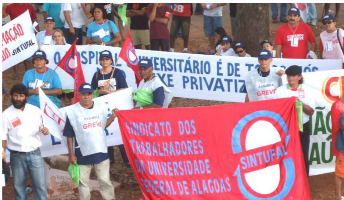
Servidores devem ter disposição para participar da luta em defesa dos seus direitos em todos os níveis

A administração das IFE's e o próprio sindicato têm investido em seus membros e não medem esforços, quando necessário, para qualificar a participação na CIS. Só isso não basta, é necessário que a categoria cobre mais empenho de seus representantes. Depois das eleições há um abandono das discussões. Iremos realizar uma assembléia, debater o assunto e organizar o processo eleitoral, para que cada membro apresente o seu desempenho e o que fez em prol da categoria.