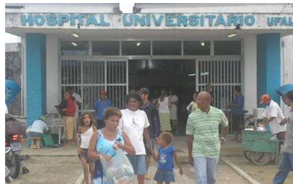
A procura por serviços do HUPAA continua crescendo

Durante a última greve funcionários, quando, tivemos sérios problemas na maternidade do HUPAA. Os funcionários da enfermagem já vinham discutindo há bastante tempo com as instancias administrativas, a questão da superlotação. Tudo em virtude da crise no atendimento do sistema SUS que restringe, cada vez mais, o acesso ao Serviço Público de Saúde.