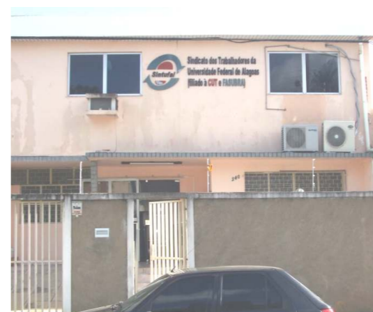
Sede do sindicato, adquirida com recursos próprios

Temos um patrimônio considerável e superávit financeiro, garantindo que nossa categoria esteja sempre pronta para qualquer luta em defesa de conquistas dos trabalhadores. Fazemos este relato para que todos lembrem a situação crítica do passado e o momento que vivemos.