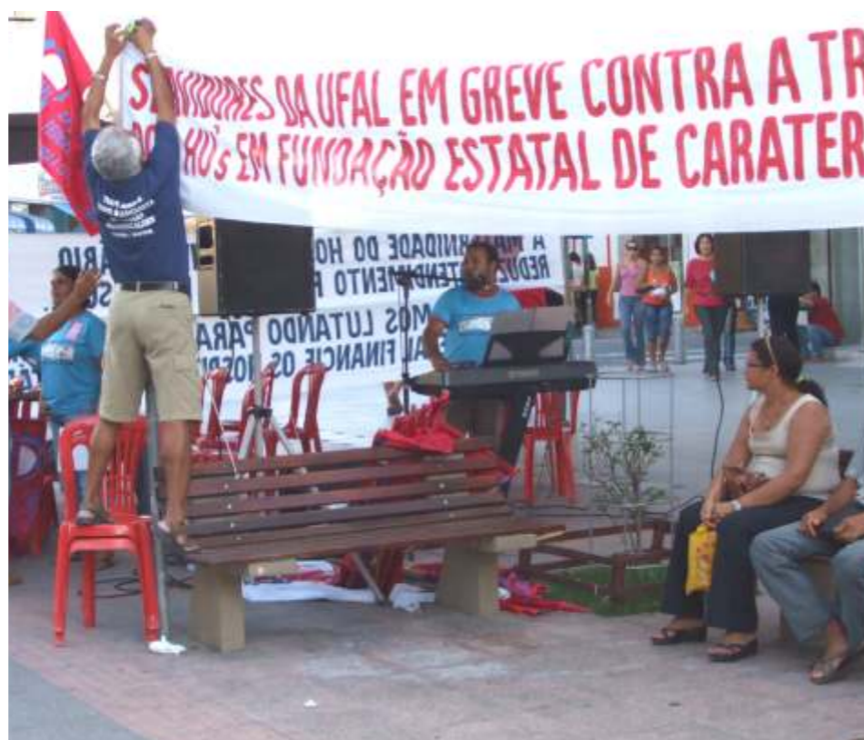
Tenda será armada no centro da cidade para coleta de assinaturas como aconteceu na greve de 2007

Se você é aposentado e deseja participar, compareça a sede do SINTUFAL. Você pode, também, apresentar-se como voluntário para ajudar no trabalho de verificação de pressão arterial que faremos nos locais de coletas de assinaturas para atrair as pessoas. Vamos usar a mesma estratégia nas regiões de praia e nas comunidades da periferia de Maceió.