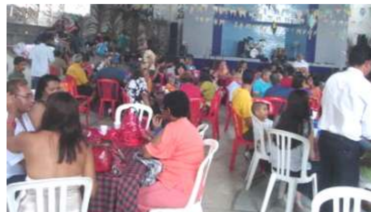
Servidores compareceram a festa com seus familiares

A festa junina do SINTUFAL, realizada em julho, apesar do adiamento, foi de muita animação para os participantes. A nova metodologia (utilizada nas últimas festividades) de se cobrar um valor mínimo para custear o evento trouxe satisfação a todos que ficaram felizes com a programação e o serviço de buffet.